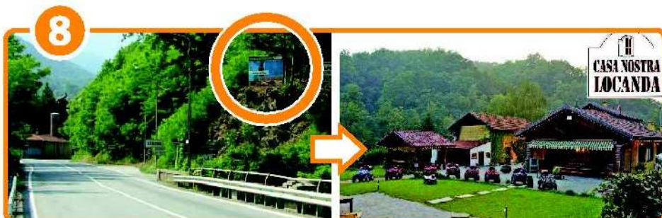
Km 22,500 Poco dopo Strona , c'è la Locanda Casa Nostra , dove potrete rifocillarvi dopo la vostra gita al Parco Avventura o il vostro splendido Bungee Jump. Voi proseguite dritto! In alto a destra, lo vedete, c'è un altro dei nostri cartelli!