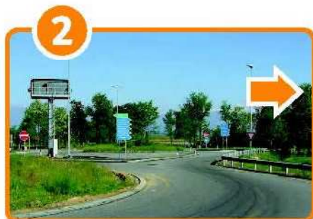
Appena usciti dall'Autostrada, prendere a destra per Cossato , azzera il conta chilometri!