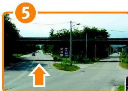
Km 13,100 Appena prima di Cossato , svoltare a sinistra per la nuova strada, in direzione di Valle Mosso anziché andare verso il centro di Cossato