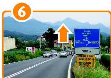
Km 15,400 Alla rotonda, proseguire dritto per Valle Mosso