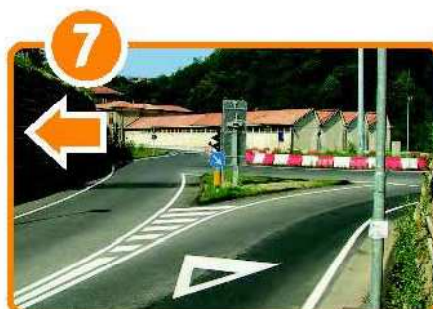
Km 20,500 Usciti dalla galleria , girare a sinistra alla rotonda