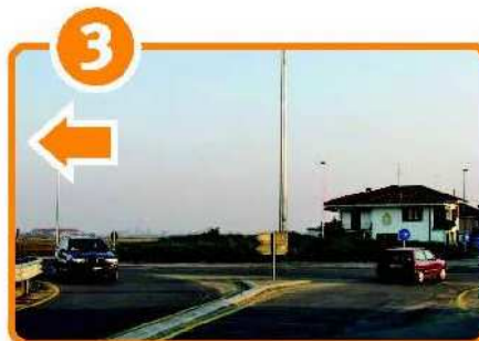
Km 1,100 Alla rotonda, nei pressi del ristorante l'Angolo (a sinistra), prendere a sinistra per Biella