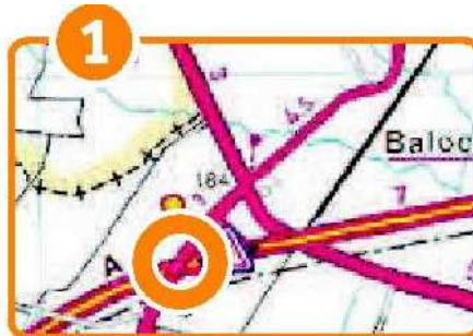
Uscita Carisio , Autostrada A4 Torino-Milano